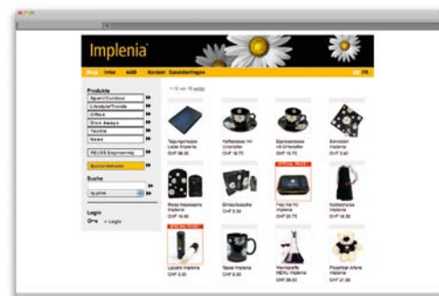
E-Shop der Firma Implenia Management AG

Seit über 40 Jahren erfolgreich im Werbeartikel-Geschäft tätig, ist heute Pandinavia führend im Bereich Outsourcing und beschäftigt über 30 Mitarbeiter. Eine Niederlassung in Hong Kong, ein weltweites Lieferantennetz sowie szenennahe Mitarbeiter garantieren ein umfassendes Angebot mit hervorragenden Preis-Leistungs-Werten: von klassischen Give-Aways bis zu hochwertigen Textilien aus den unterschiedlichsten Bereichen.